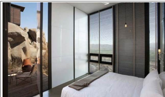
imagen de referencia # 3