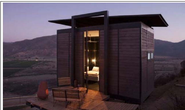
imagen de referencia # 1